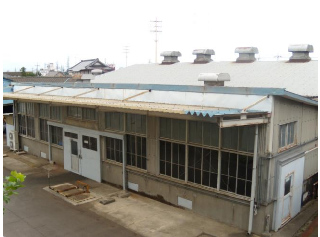
▲ 北西側やや上方から撮影 (ルーフファン有)