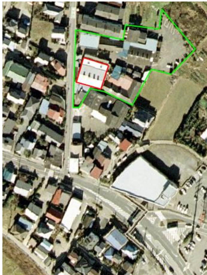
▲ 航空写真 (赤枠が賃貸物件)