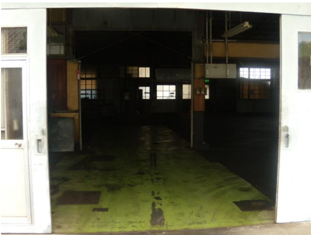
▲ 正面(北側)扉から撮影 (開口部;W3,550×H2,500 mm)