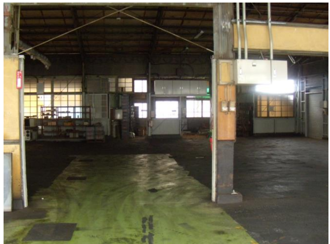
▲ 北側から内部 (床寸法 W20m×D20m)